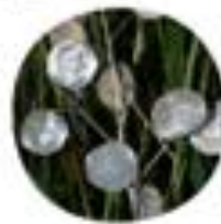
Liatris pycnostachya Enoletna sreboenka