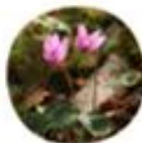
Cyclamen persicum Navadna ciklama