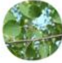
Populus tremula Navadna trepetlika