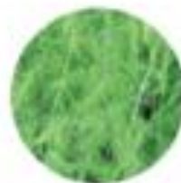
Asparagus officinalis Vrtni ipargelj