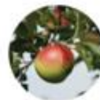
Malus sp. jablana