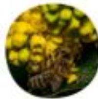
Mahonia aquifolium Navadna mahonijska