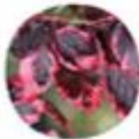
Fagus sylvatica "Bonsenmargitata" Skrlatnomrtnata bukva