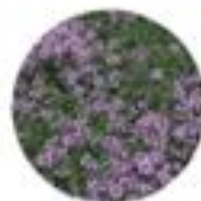
Thymus vulgaris Vrtni timijan