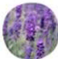
Lavandula angustifolia Prava sivka