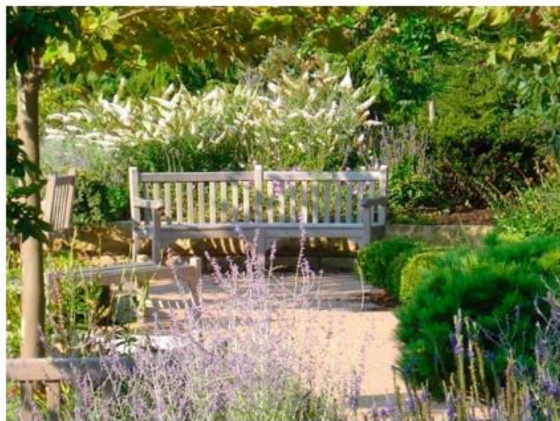
Slika 7: Vrt pri Medicinskem centru Anne Arundel, Gainesville, je postavljen na nižji nivo in obdan s stavbami. S tem daje obiskovalcem občutek varnosti in zavetja (Healing garden, 2020) (levo), v terapevtskem vrtu Lake forest hospital je za klopjo zasajen visok beli metuljnik ( Buddleia davidii 'Alba'), ki daje obiskovalcu občutek varnosti (Dr. Hugh falls..., 2007) (desno).