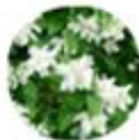
Philadelphus coronatus Nepravi jasmin