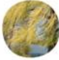
Salix Caprea 'Pendula' Povelava vrba