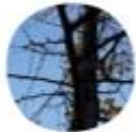
Ginkgo biloba Dvočrni ginko