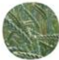
Triticum aestivum Navadna pšenica