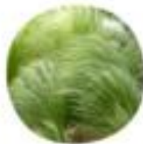
Sida leucantha Bodolica