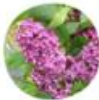
Syringa vulgaris Španki brez