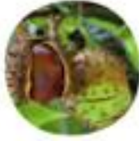
Asculus hippocastanum Divji kostanj