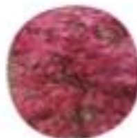
Acer palmatum Japonski javor