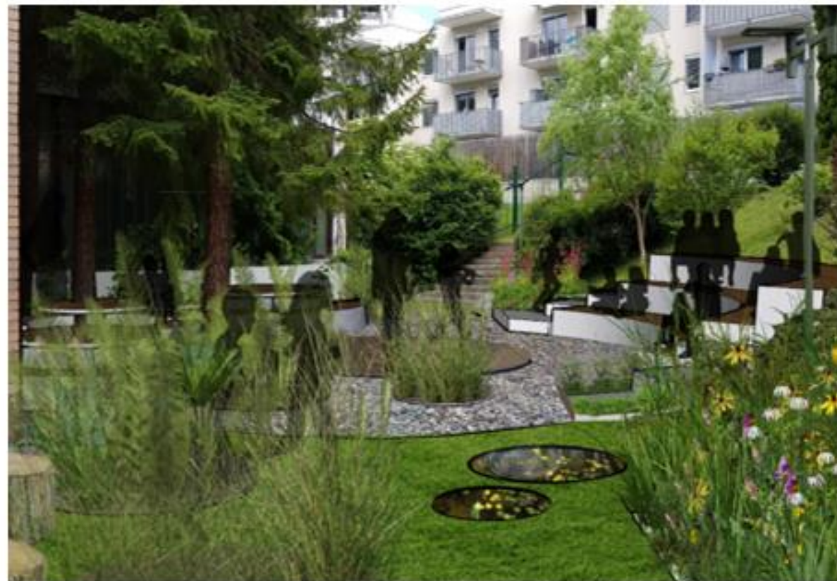
Slika 5: Buehlerjev vrt v Botaničnem vrtu v Chicago z dvignjenimi gredami različnih višin, ki omogočajo dostop različnim uporabnikom prostora: tistih na invalidskih vozičkih, slepim ali slabovidnim in drugim obiskovalcem (Universal design: Gardens, 2014) (levo), nerealiziran projekt Učilnice na prostem OŠ Gorica, Velenje, kjer je prostor prilagojen učenju in vrtnarjenju (Maja Smonkar in Nina Friškovec) (desno).