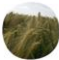
Hordeum vulgare Jočmen