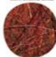
Cerasus sanguinea Rdeči dren