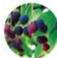
Amelanchier lamarckii Šenarna hralica