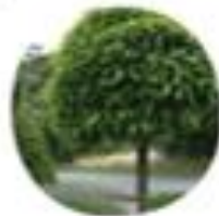
Catalpa bignonioides Navadni cigarovec