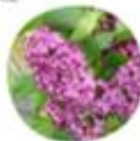
Neranga rugosa Španski breg