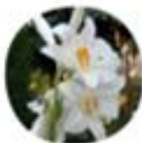
Lilium candidum Alojzjeva lilija