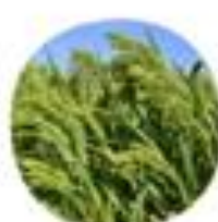
Panicum mollicornis Navadno proso