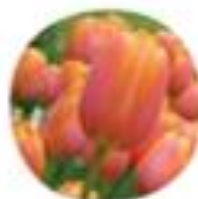
Tulipa gesneriana Tulipan