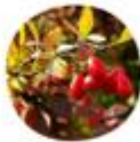
Berberis thunbergii Thunbergov čelmin