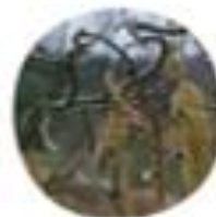
Corylus avellana "Contorta" Skovrsčena lešca