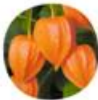
Physalis alkekengi Navadno volčje jabolko