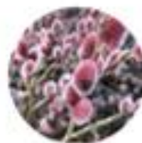
Salix gracilistylis "Mount Asai" japonska vrba