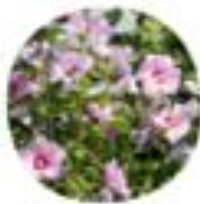
Hibiscus syriacus Vrtni oslez