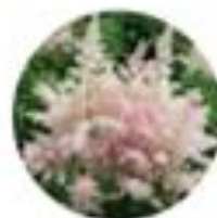
Astilbe sp. Kresnica