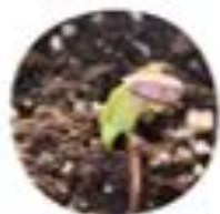
Helianthus annuus Navalna sončnica