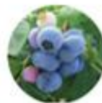
Vaccinium corymbosum Ameriške borovnice