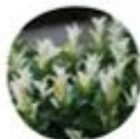
Eustoma japonicum "Paloma Blanca" Japonska trdoleska