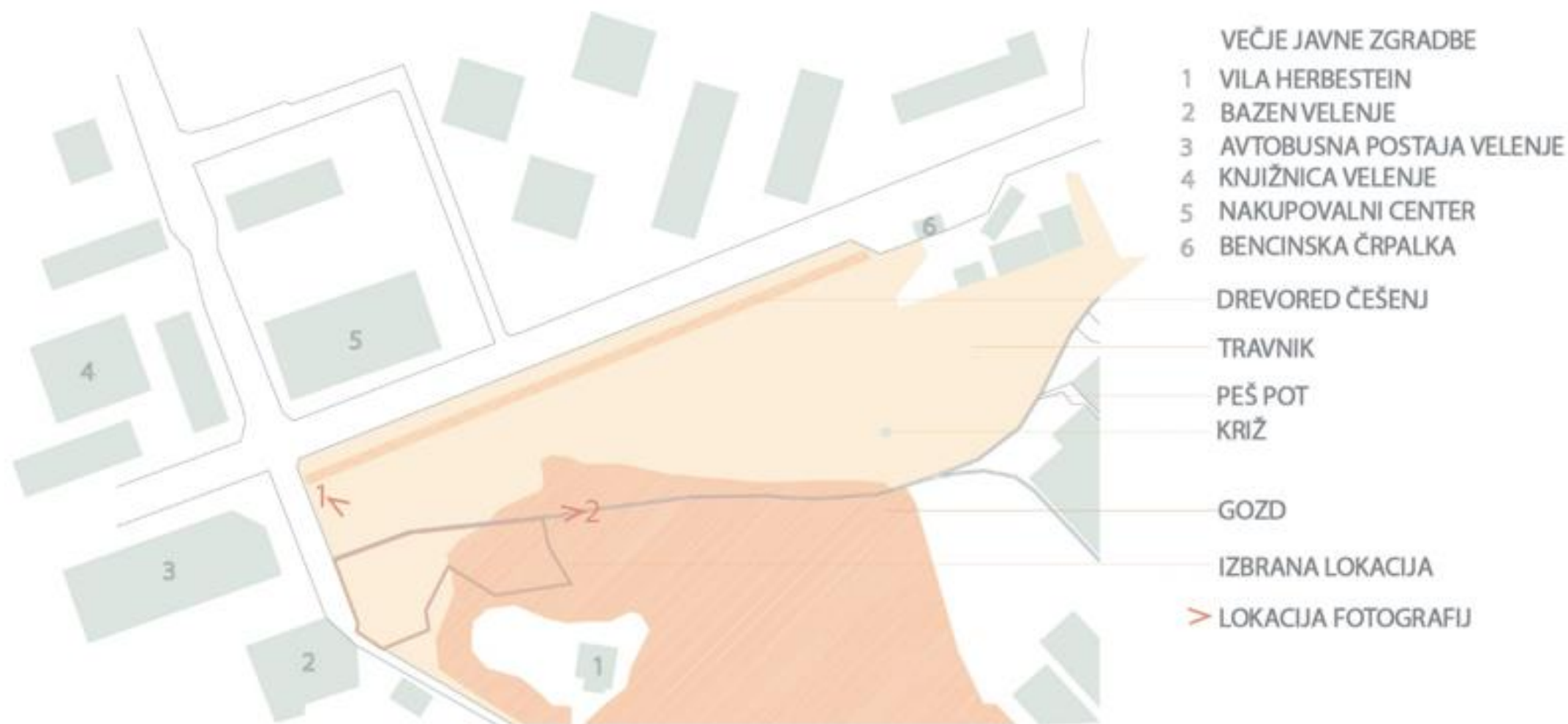
Slika 23: Izbrana lokacija območja (po spletnem viru PISO, 2020)