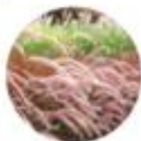
Pennisetum ruppelii Setinava perjenka