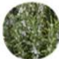
Salvia rosmarinus Navadni rosmarin