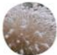
Pennisetum sp. Perjenka