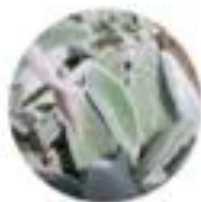
Stachys lanata Volčni čiljak