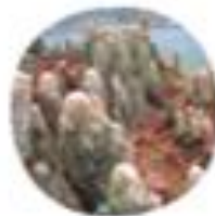
Taxodium distichum Močvirna cipresa