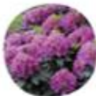
Rhododendron sp. Rododendron