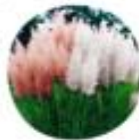
Carex flacca Pampalka trava