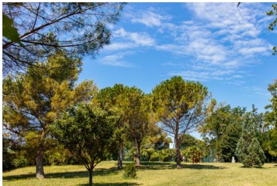
Slika 1: Nekdanji moški paviljon, danes vojašnica slovenskih pomorščakov (Vojašnice, 2020) (levo), parkovna ureditev Ankaran (Ankaranski polotok, 2020) (desno).