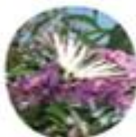
Buddleja davidii Davidov metuljak