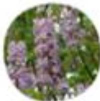
Paulownia tomentosa Navadna pavlovinja