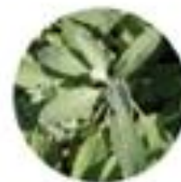
Salvia officinalis Zajbelj