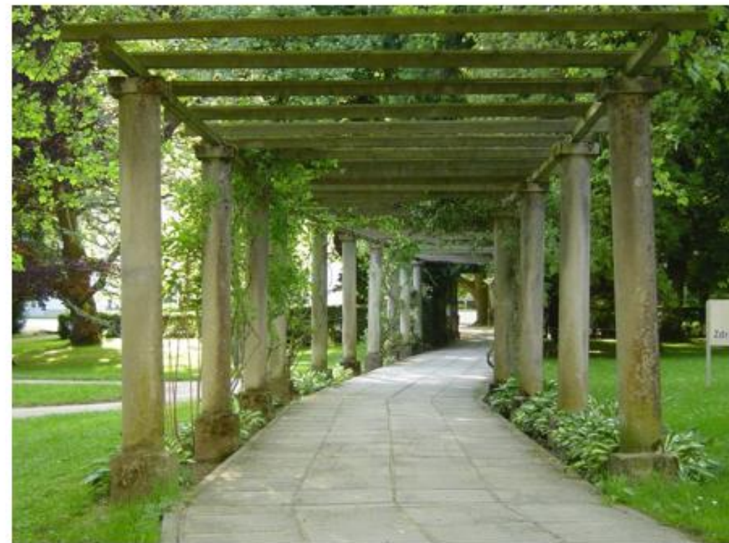
Slika 3: Terme Dobrna z zunanjo ureditvijo (Ohranjanje zdravja..., 2017) (levo), pergola v zdraviliškem kompleksu Dobrna po izvedbi sanacije parkovnih sestavin (Grmovšek in sod., 2017) (desno).