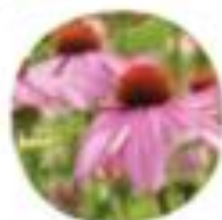
Echinacea purpurea Ameriški slatkoik