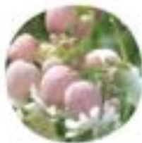
Silene vulgaris Navadna pokalica