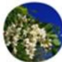
Robinia pseudoacacia Navadna robinija