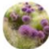
Allium giganteum Okrasni luk