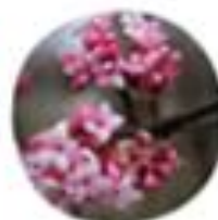
Elaeagnus x bodnantensis Bodnantska brogotka