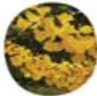
Slika 21: Nabor rastlin, ki pritegnejo pozornost z izrazitim sezonskim spreminjanjem