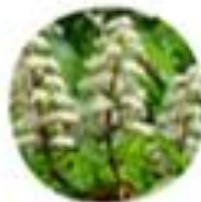
Aesculus hippocastanum Divji kostanj