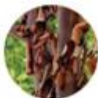
Acer griseum Sivi javor