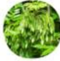
Fraxinus excelsior Veliki jesen