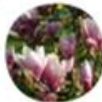
Magnolia liliflora Lilijasta magnolija