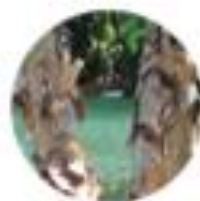
Betula nigra Črna breza