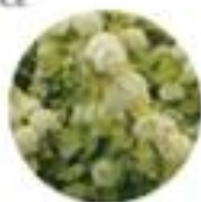
Physocarpus opulifolius Kalinedistni pokalec