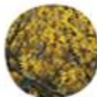
Hamamelis virginiana Virginski nepoustnik