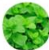
Mentha piperita Peperova meta