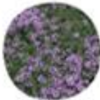
Thymus vulgaris Vrtni timijan