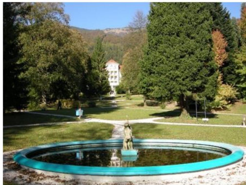
Slika 2: Ptičja perspektiva kompleksa Univerzitetne klinike Golnik (Klinika Golnik, 2020) (levo), park Golnik (Park Golnik, 2020) (desno).