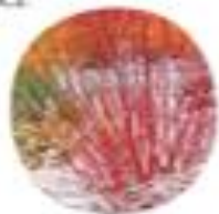
Cornus sanguinea Rdeči dren