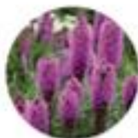
Liatris spicata Klamati liatris