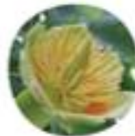
Liriodendron tulipifera Navadni tulipanovec