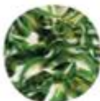
Hosta undulata Hosta