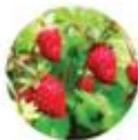
Fragaria vesca Gordna jagoda