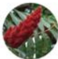
Rhus typhina Naračni oktovec