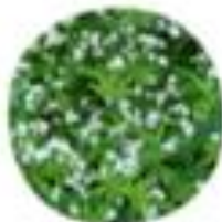
Galium verum Droča lukota