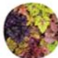
Heuchera sp. bčrtnka