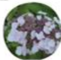
Hydrangea macrophylla Hortenzija